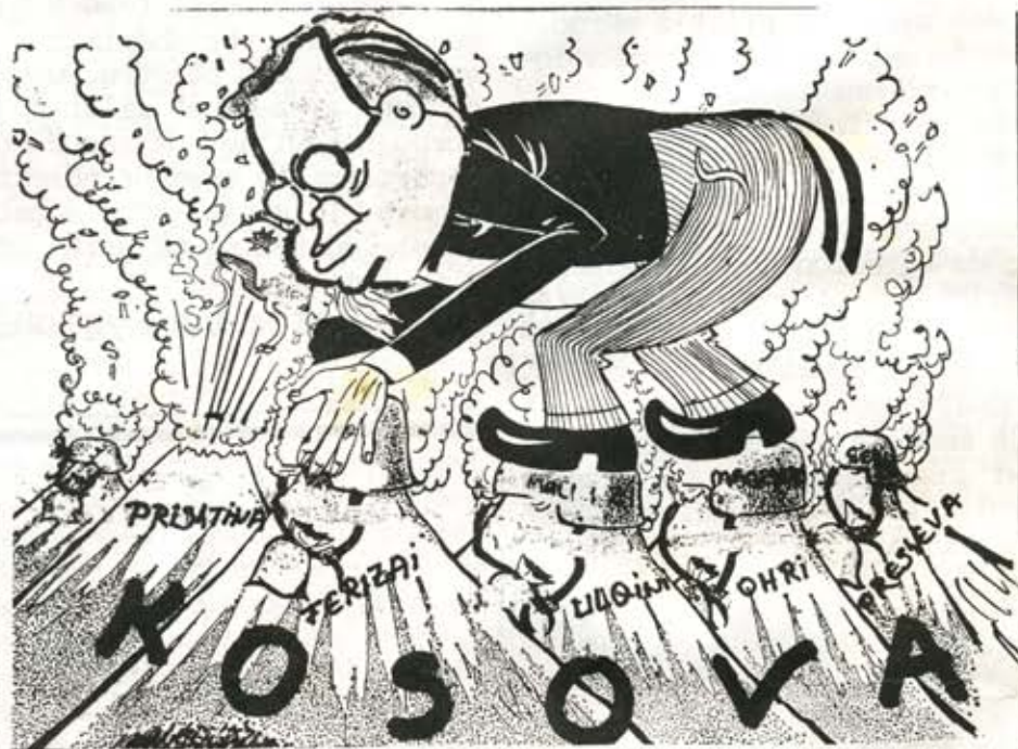
UDB-ES PO I DIGJET TOKA NËN KËMBË NË KOSOVË

Para neve punëtorëve, populli dhe atdheu venë detyrë konkrete që të organizohemi sa më mirë dhe sa më fortë në Bashkimin e Punëtorëve të Kosovës dhe të qëndrojmë në ballë të frontit në luftën politike për realizimin e të drejtave në pavarësi dhe barazi-në Republikën S.SH. të Kosovës.